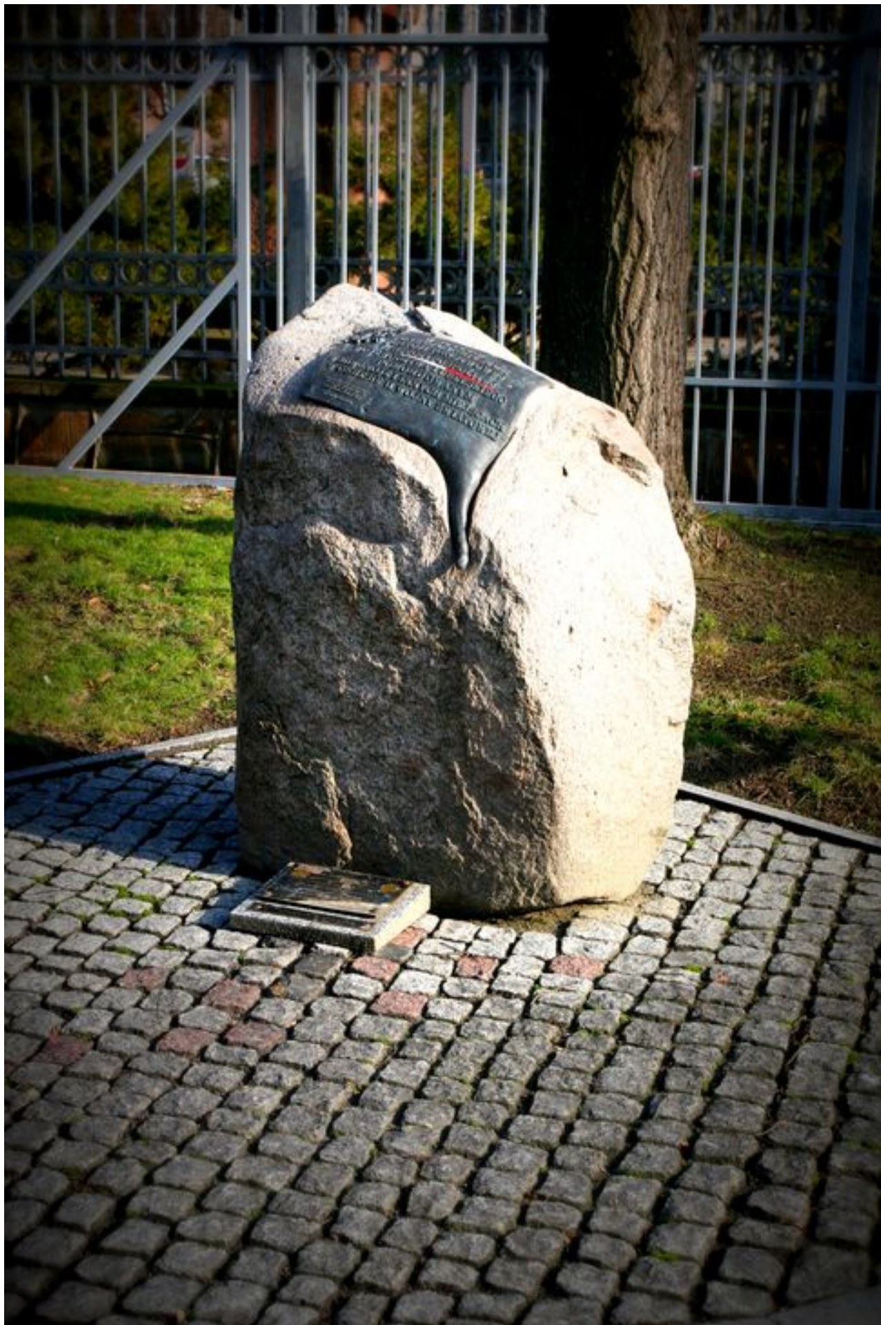
Podczas uroczystości odsłonięcia pomnika-tablicy byli obecni: