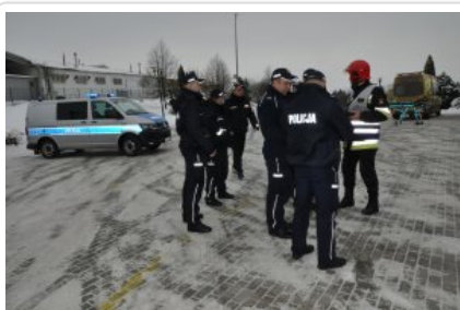
Ćwiczenia służb „Arena 2018”