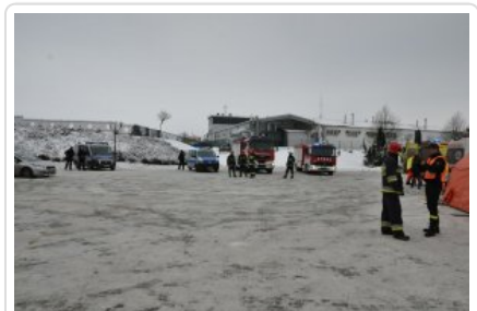
Ćwiczenia służb „Arena 2018”