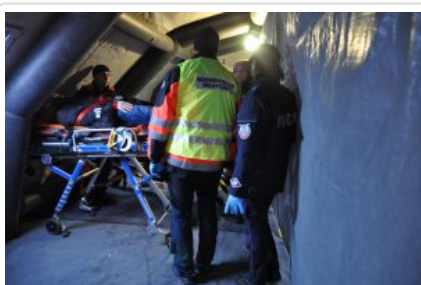
Ćwiczenia służb „Arena 2018”