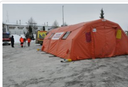
Ćwiczenia służb „Arena 2018”