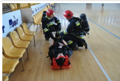
Ćwiczenia służb „Arena 2018”